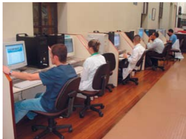
La innovación tecnológica se hace presente en BINASSS, sin dejar de lado la forma convencional de trabajo.

Todo estos esfuerzos descritos han hecho que BINASSS, tras 25 años de existencia, se convierta en la más completa y actualizada biblioteca en salud del país. Asimismo, le han permitido mantenerse a la vanguardia en el campo de la información científico-técnica, no sólo por la cantidad de documentos, libros y revistas que posee (en línea y en papel), sino por la calidad y el fácil acceso a los mismos.