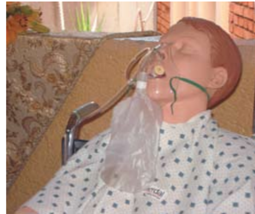
Uno de los grandes apoyos didácticos utilizados en la formación de auxiliares de enfermería son los maniqués, como el que se muestra en la imagen.

Según un reporte brindado por dicha dependencia, hasta el mes de agosto del presente año, 277 médicos de distintas regiones del país han realizado el curso de manera satisfactoria.