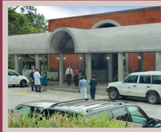
CENDEISSS, un centro especializado en formación y capacitación.