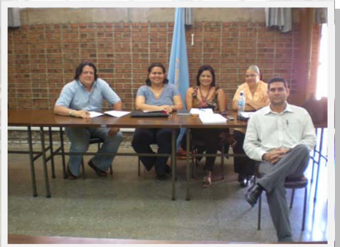
Participantes al Curso de Consentimiento Informado, efectuado del 14 al 16 de marzo de 2011