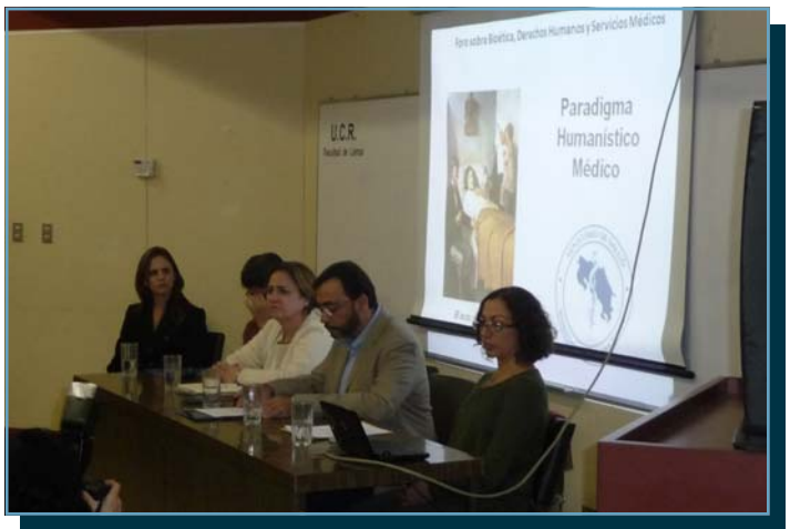
“Bioética, derechos Humanos y Servicios en Salud” realizada en la Escuela de Filosofía de la Universidad de Costa Rica.

También, el Comité de Bioética Local del Hospital Tony Facio, Limón, organizó una actividad de divulgación en la que se presentó la charla “El consentimiento informado (investigación/relación clínica). En este caso la asistencia fue de 53 personas, en su mayoría profesionales de ciencias médicas.