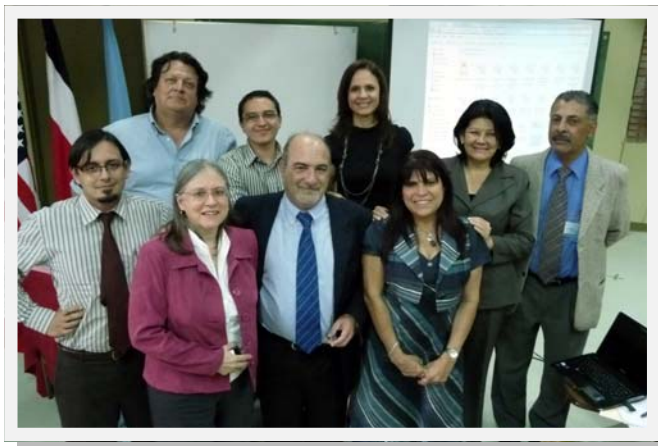
Equipo de profesionales del programa CITI, representantes de varios CLOBI y del Área de Bioética, que participaron en la elaboración del módulo de Consentimiento Informado.

En cuanto a los objetivos de aprendizaje, estos tienen que ver principalmente con el reconocimiento de la importancia de obtener el consentimiento informado y describir en forma precisa dicho proceso.