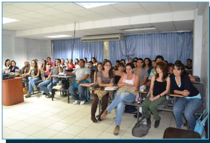
Estudiantes de tercer año de la Carrera de Enfermería de la Universidad de Costa Rica presentes en la conferencia “Principios de la bioética y normativa actual de la investigación en la Caja Costarricense de Seguro Social”.

En la Universidad de Costa Rica, se impartió la charla denominada “Principios de la bioética y normativa actual de la investigación en la Caja Costarricense de Seguro Social”, la asistencia fue de 45 estudiantes de tercer año de la carrera de Enfermería.