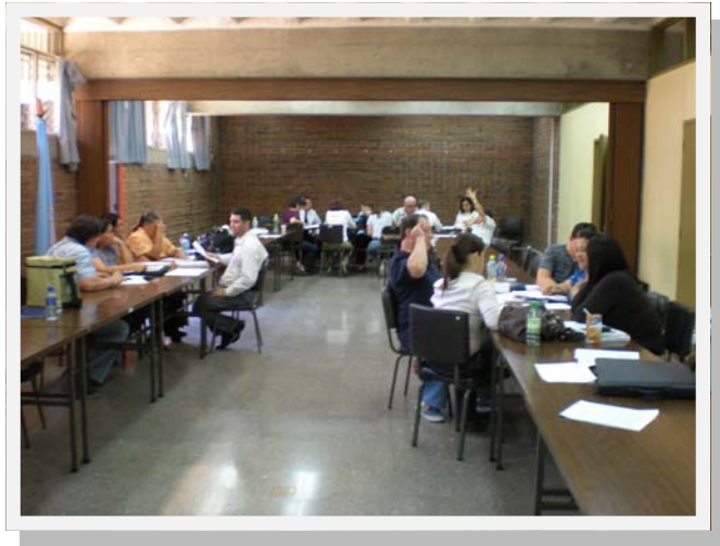
Participantes al Curso de Consentimiento Informado, efectuado del 14 al 16 de marzo de 2011

El texto anterior sirvió de justificación para llevar a cabo el primer “Curso de consentimiento informado”, los días 14, 15 y 16 de marzo del presente año. Asistieron 20 personas de diferentes centros de salud de la Caja, quienes destacaron la importancia de que la actividad se incorpore al plan de capacitación anual dirigido por el Área de Bioética.