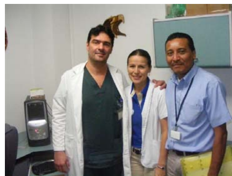
Miembros del CLOBI del Hospital de Golfito