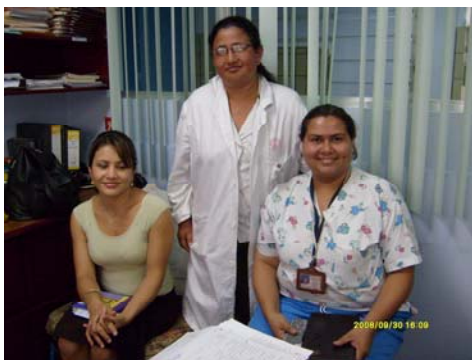
Miembros del CLOBI del Hospital de Los Chiles