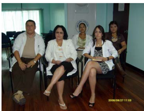
Miembros del CLOBI del Hospital de Ciudad Neilly