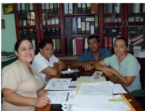
Miembros del CLOBI del Área de Salud de Bagaces

Por otra parte, también se han hecho visitas de inducción a todos los comités integrados en el año 2008, con el fin de brindarles información sobre el funcionamiento de dichos órganos. A continuación se presentan algunas fotos tomadas en estas visitas.