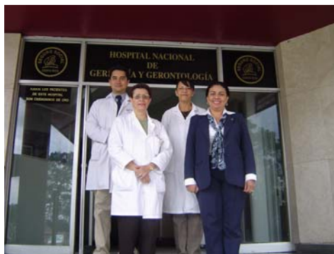
Miembros del CLOBI del Hospital Nacional de Geriatria y Gerontología Dr. Raúl Blanco Cervantes