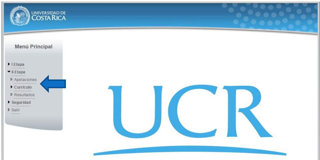
Ilustración 4. Menú Principal

Nota: Si no se encuentra en periodo de solicitud de primera apelación la pantalla no permite crear solicitudes.