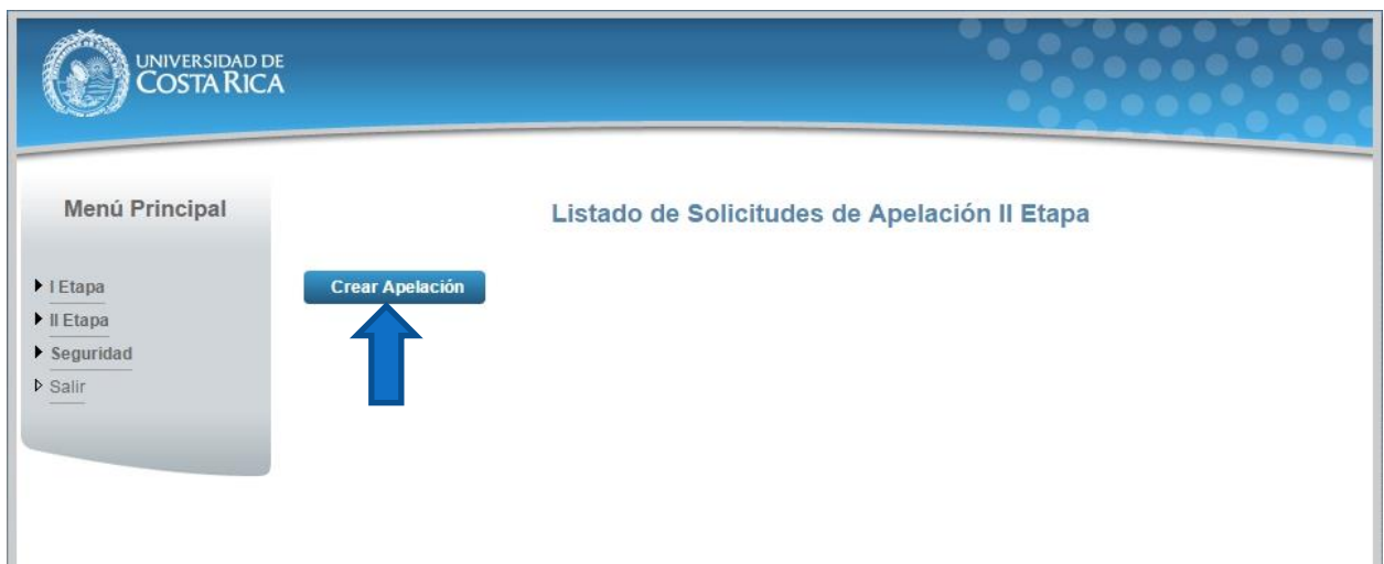
Ilustración 5. Listado de Solicitudes de Apelación (Crear Apelación)