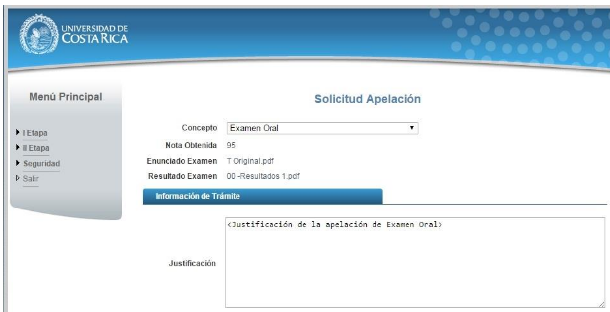
Ilustración 9. Formulario solicitud apelación (Examen Oral)