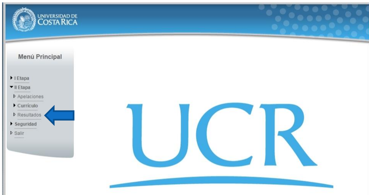
Ilustración 2. Menú Principal (Opción resultados de Segunda Etapa)