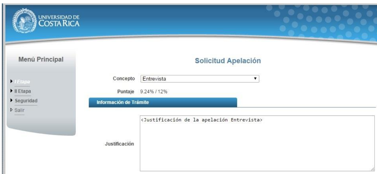
Ilustración 8. Formulario solicitud apelación (Entrevista)