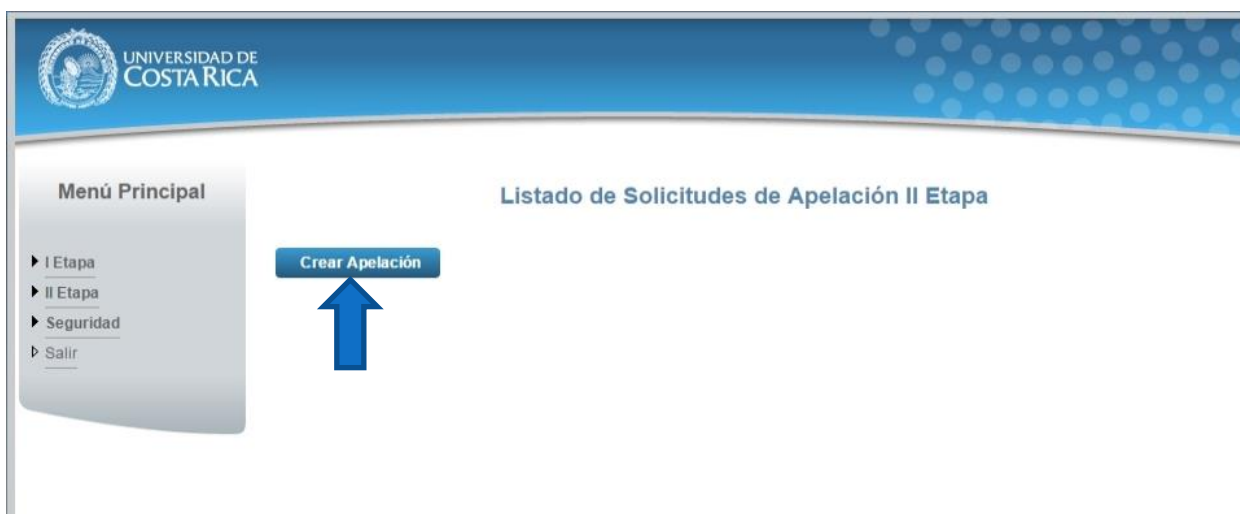
Ilustración 5. Listado de Solicitudes de Apelación (Crear Apelación)