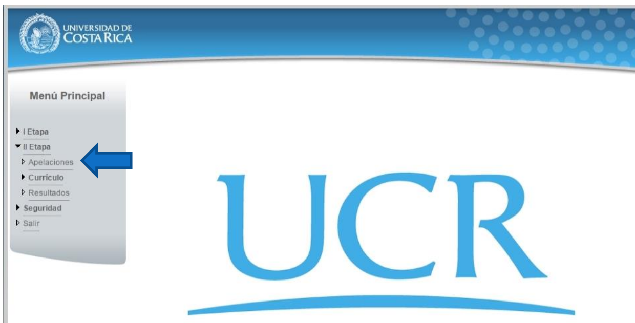
Ilustración 4. Menú Principal (opción de Apelaciones)

Nota: Si no se encuentra en periodo de solicitud de primera apelación la pantalla no permite crear solicitudes.